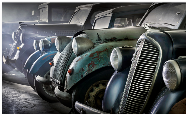
Archival Matt 260 archival matte paper 260 g/m 2